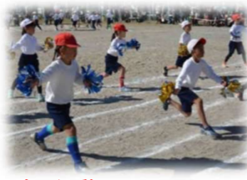
表現運動 リボンを付けてリズム良くダンス