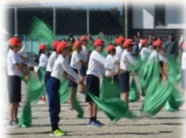
表現運動 ”羽ばたけ未来へ”