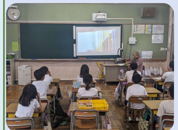
プロジェクターを使い読み聞かせ