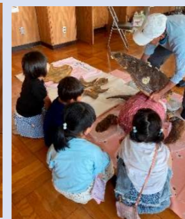
標本を見ながら、カメの様子が理解できた