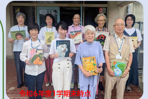
読み聞かせボランティアの皆さん

ボランティアを引き続き募集しております。ご興味のある方はぜひお気軽に見学にいらしてください。 ◇連絡先 石薬師小学校 059-374-1028