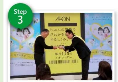
売上1%の寄付金が還元