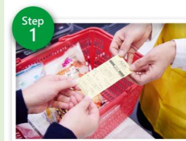
毎月11日 黄色レシート発行

日頃より石薬師小学校の教育活動並びにPTA活動に対しましてご支援ご協力いただき深く感謝申し上げます。本校PTAは【イオン幸せの黄色いレシートキャンペーン】に登録しています。【イオン幸せの黄色いレシートキャンペーン】とは毎月11日にマックスバリュ岡山店で買い物をすると黄色いレシートが発行されます。その黄色いレシートを『石薬師小学校PTA』投函BOXに入れていただくと年間合計金額の1%が寄付されます。PTA活動並びに子ども達の学校生活の向上に役立たせていただいております。引き続きご支援ご協力の程よろしくお願いたします。